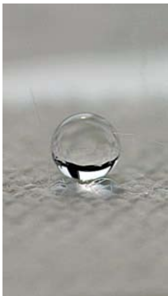
Wassertropfen bleiben auf dem Gewebe als Kugeln stehen und rollen dann ab.

■ Warum es lohnt , seine Werte zu kennen: Wenn jemand pro Stunde Radfahren mit 138 Puls 500 Kalorien an Fett verbraucht und 5 kg Fett abnehmen will (1 kg Fett = 7500 Kalorien), muss er dafür ca. 75 Stunden Rad fahren.