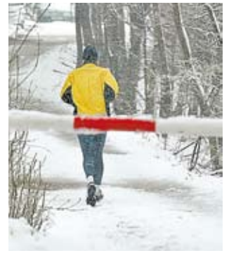
Bei großer Kälte sollte man sich langsamer bewegen.

Es gibt kein schlechtes Wetter, sondern nur schlechte Kleidung, heißt es. Trotzdem sollten Sportler beim Training im Freien einiges beachten. Je kälter die Luft ist, desto langsamer sollten die Bewegungen ausfallen. Ansonsten wird Sport für den Körper zum Stress. Neben warmer Kleidung ist Aufwärmen angesagt, um Muskelverletzungen zu vermeiden. Ab minus 15 Grad sollten alle Aktivitäten im Freien eingestellt werden. (dpa)